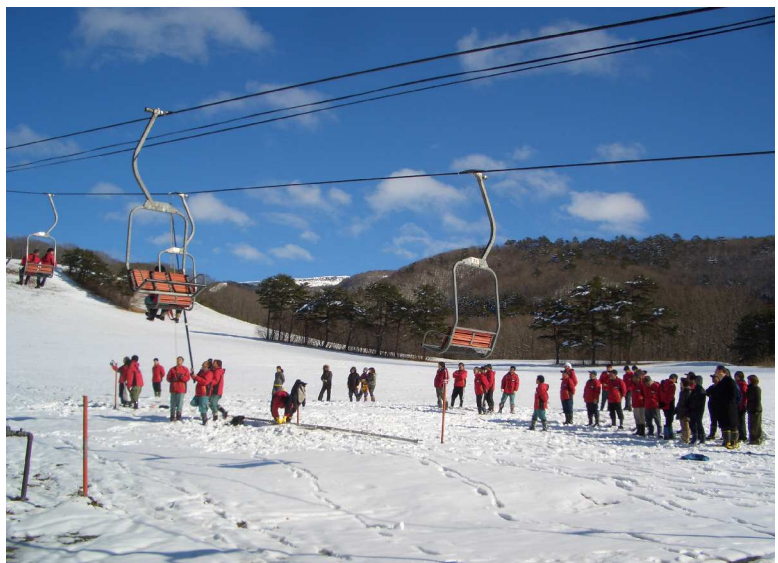
【救助訓練実施状況】