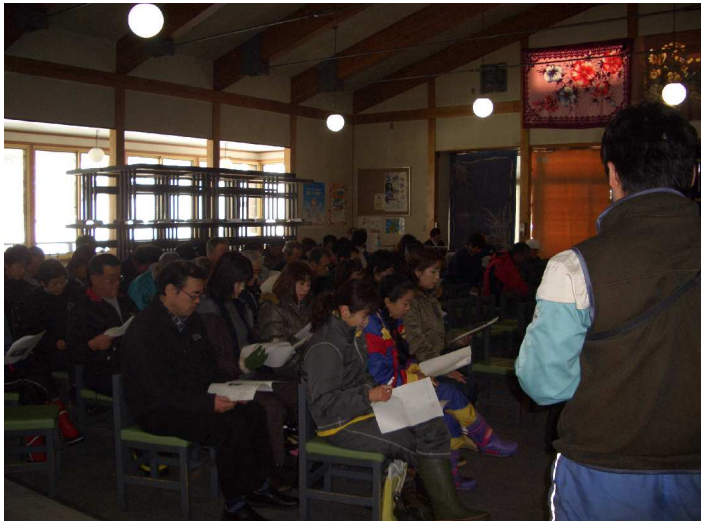
【室内での救助用具の説明】

毎年、シーズン営業開始前に、従業員一同にて安全に対する講義と救助訓練を実施しています。