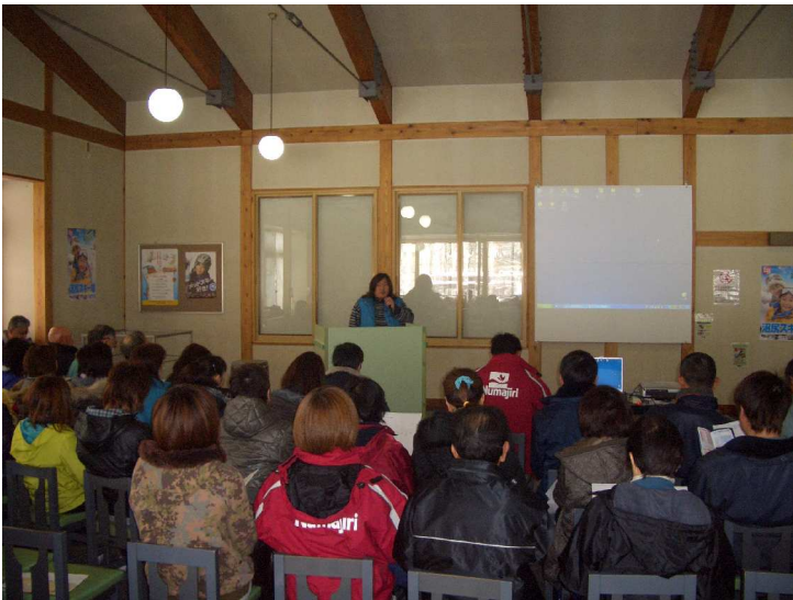
【従業員研修会の風景】

当社では、シーズン営業開始前に施設及び取扱いについての安全教育を実施しています。