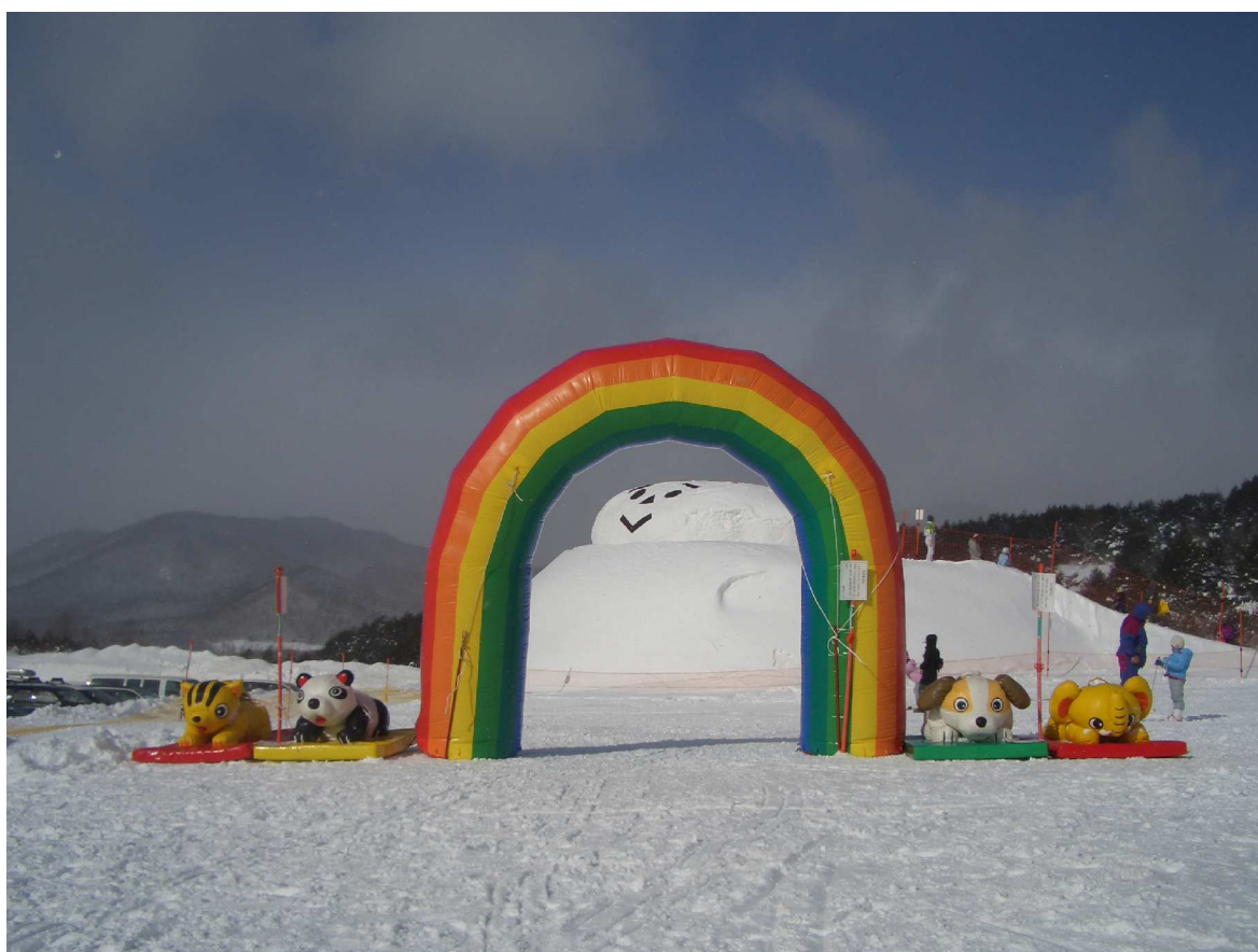
チビッコゲレンデ入口