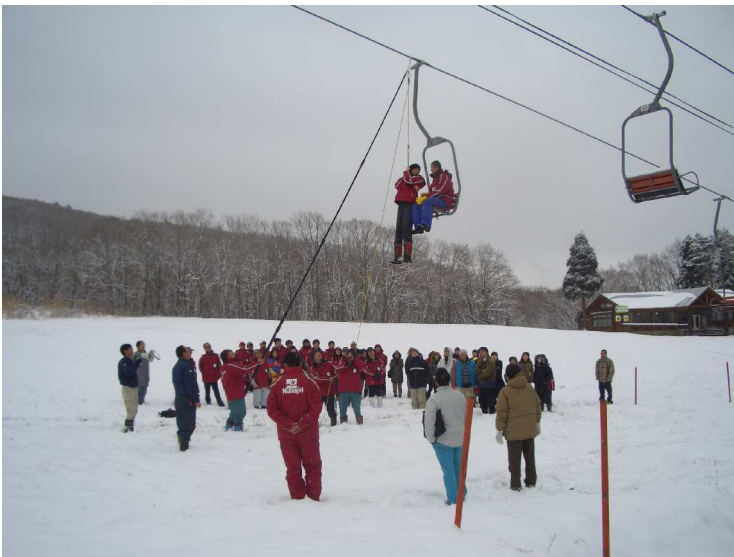
【救助訓練実施状況】

毎年、シーズン営業開始前に、従業員一同にて安全に対しての講義と救助訓練を実施しています。